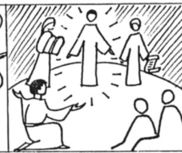
Mt 17, 4