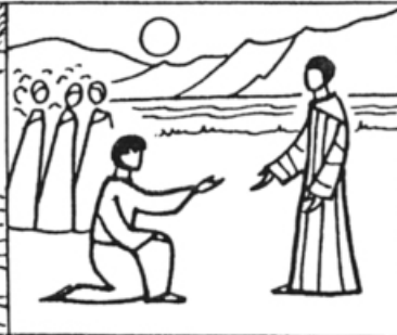
Mt 16, 16