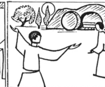
Jm 20, 3