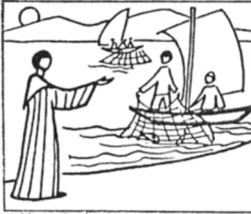
Mt 14, 19