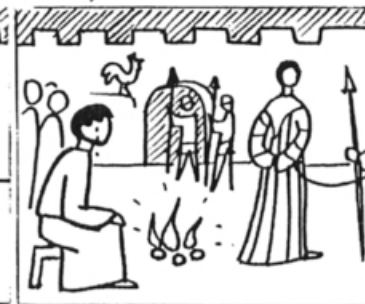
Lc 22, 61