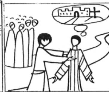
Mt 16, 22