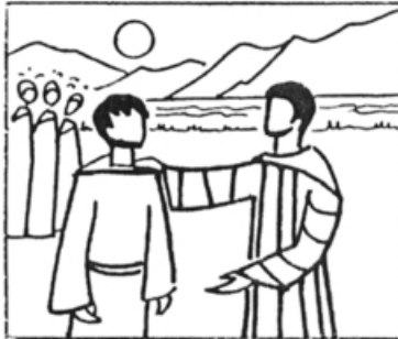
Mt 16, 18