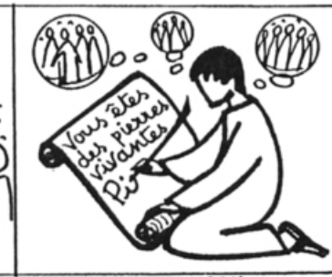
1 Pierre 2, 4