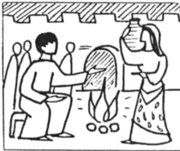
Lc 22, 57