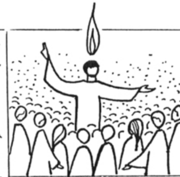
Ac 2, 24