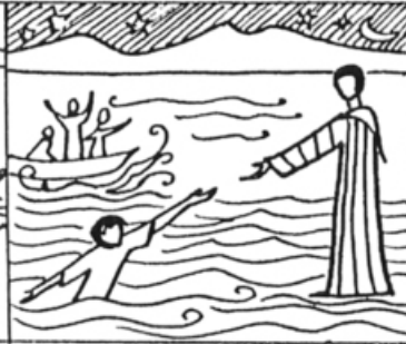
Mt 14, 30