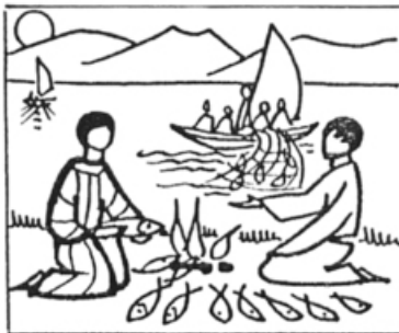
Jm 21, 16